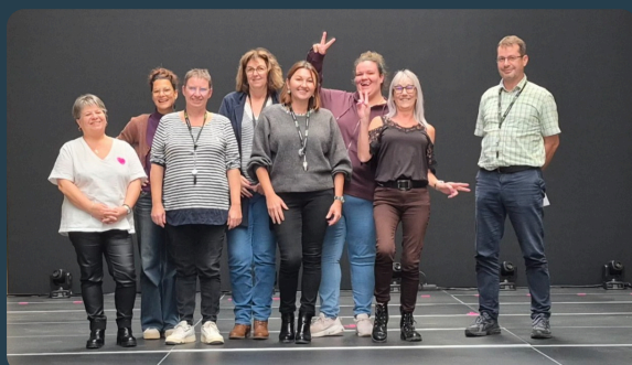
Nos collaborateurs en pleine mise en situation sur la scène de L'Élisée

L'ensemble de ces initiatives s'inscrit dans une logique de progrès continu et de professionnalisation durable des équipes.